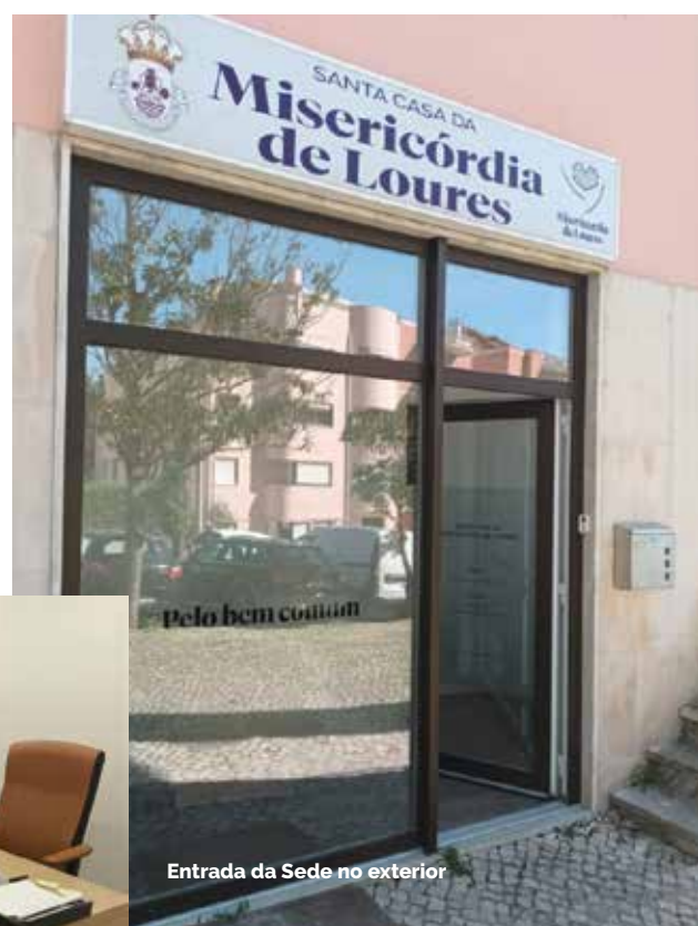
Entrada da Sede no exterior