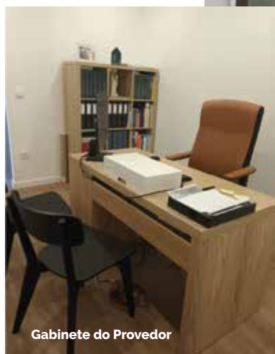
Gabinete do Provedor