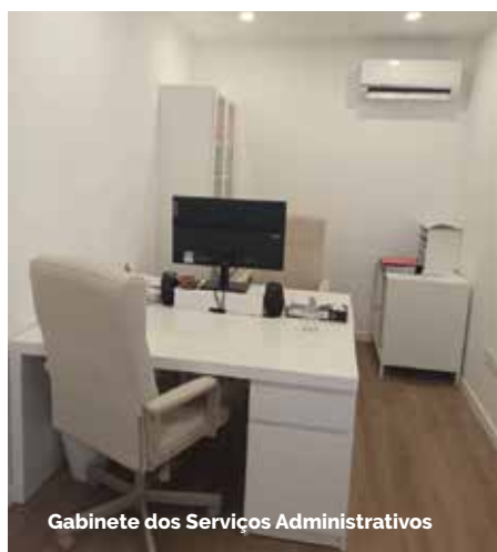
Gabinete dos Serviços Administrativos