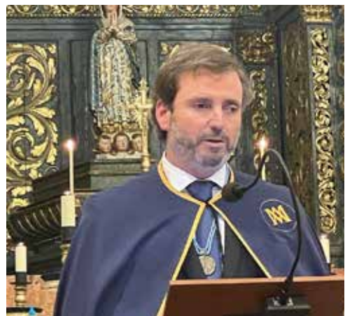
Equipa de Comunicação