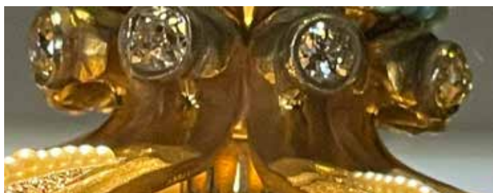
Exposição "Os Rostos de Fátima. Fisionomias de uma paisagem espiritual"